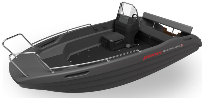
(Abbildung entspricht Special Edition Narrow)