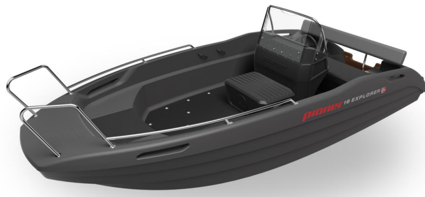
(Abbildung entspricht Special Edition Wide)